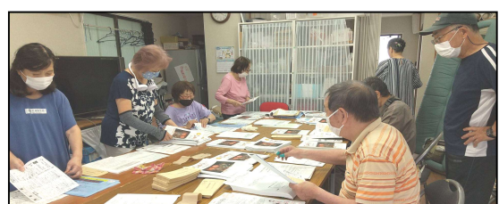
さわやか支部 7/5(日) 組合員センター-COCOLO