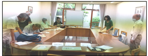
伊丹支部 7/1(水) サンシティーホール