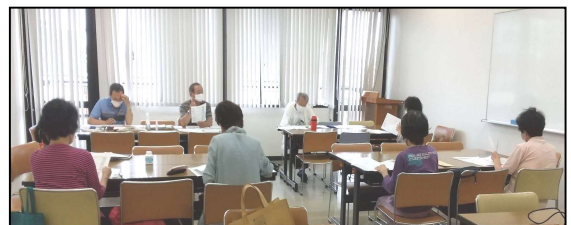
東支部 7/1(水) 東公民館