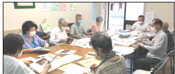
仁川支部 7/3(金) 組合員センター-COCOLO