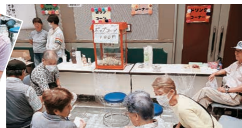
ポップコーンコーナー