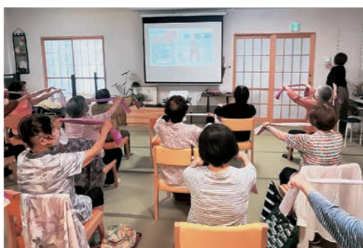
サロンえにしでおこなわれている タオル体操を見学

また、翌日には、新しくオープンした看護小規模多機能と併設したサロンえにしの見学もさせていただきました。組合員さんがイキイキと活動をしている姿や事業所との繋がりを感ぜられるような建物の造りに刺激を受けました。