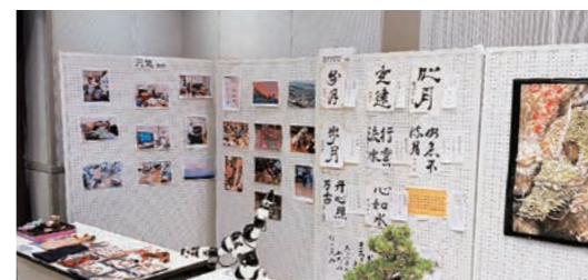
写真、書道、盆栽など多数の展示が