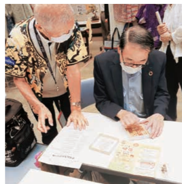
茅野理事長も脳トレパズルに 真剣な様子…