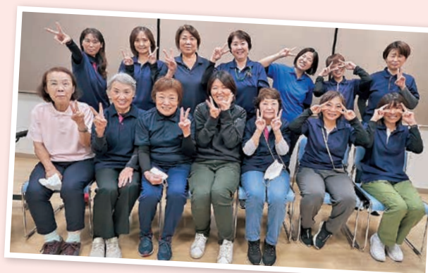
ヘルプーステーション ひだまり