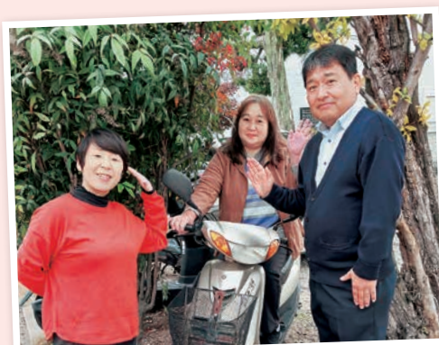
ケアサポート今津