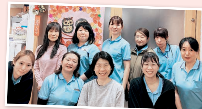
デイサービス ひだまり