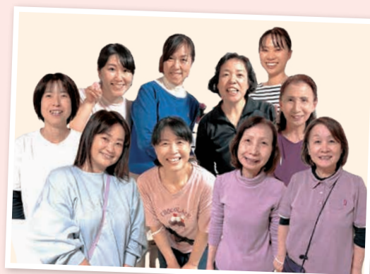
デイサービス あったかハウス今津