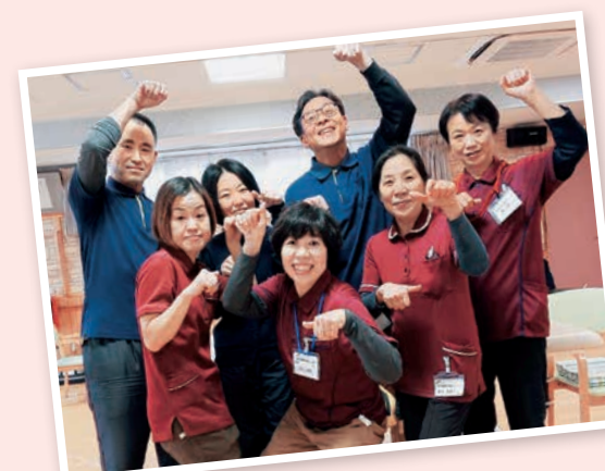
良元診療所 通所リハビリ