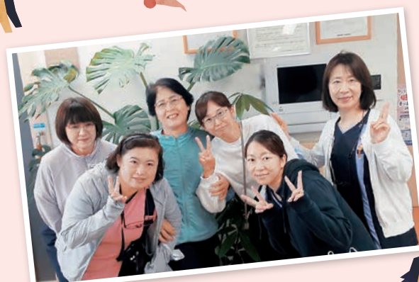
訪問看護ひだまり