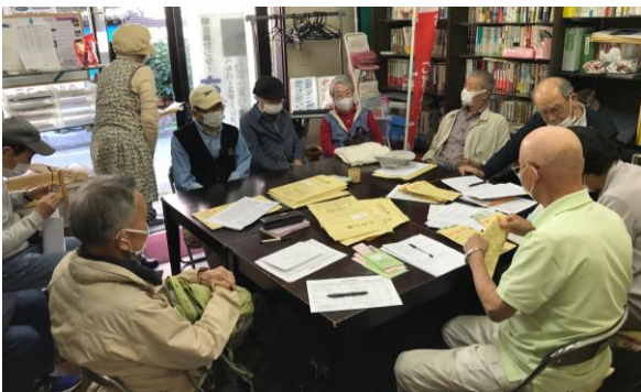
《5月8日(木)北支部支部総会》

緊急事態宣言が延長となり、班会・健康チェックの中止、外出自粛の中で大変な日々を送られている事と存じます。宝塚医療生協の医療・介護事業所では、新型コロナウイルス感染拡大防止のため、職員に丁寧な手洗い、手指の消毒、検温による体調管理を徹底して、組合員の皆様に安心してご利用いただけるよう、全力で取り組み通常営業を行っております。