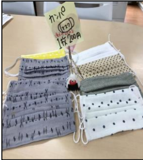
《組合員・職員皆さん手作りマスク》

緊急事態宣言が延長となり、班会・健康チェックの中止、外出自粛の中で大変な日々を送られている事と存じます。宝塚医療生協の医療・介護事業所では、新型コロナウイルス感染拡大防止のため、職員に丁寧な手洗い、手指の消毒、検温による体調管理を徹底して、組合員の皆様に安心してご利用いただけるよう、全力で取り組み通常営業を行っております。