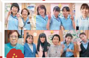
デイサービス ひだまり