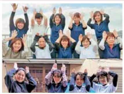
ヘルパーステーション ひだまり