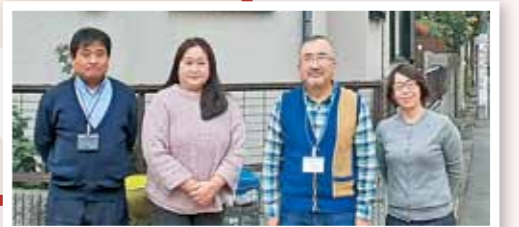
ケアサポート 今津