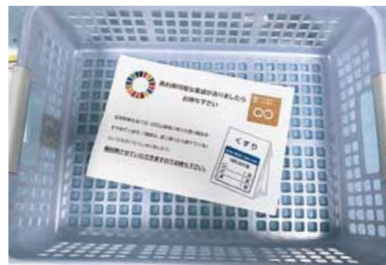
薬袋不要のトレー

●薬袋の再利用 高松診療所では、半年ほど前から薬袋(やくたし)の再利用をしています。当院は、院内でお薬をご用意しているのですが、物を大切にされる患者さんが多いためか「いつも同じ薬やから袋用意せんでいいよ」「もつたないからお薬の袋はいらんよ」という声がチラホラ