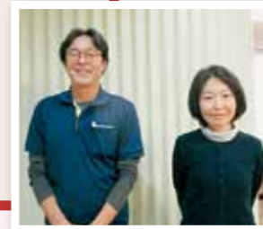
デイサービス あつたかハウス今津