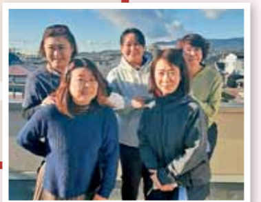
訪問看護ステーション ひだまり