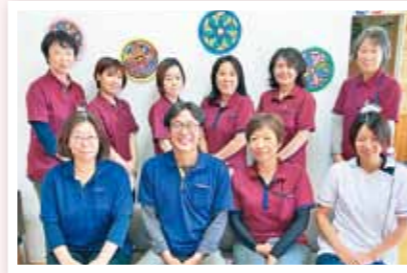
良元診療所 通所リハビリ

コロナ禍4年目を迎える年となりますが、医療・介護の現場から「その人らしくいられる」社会生活環境づくりの支援・エールを多職種連携して発信していく所存です。様々な「社会的ケア」を産出せる一年をめざしていきたいと思ひます。