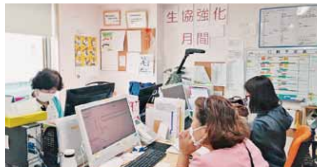
訪問看護ステーションひだまり

50周年記念式典の中で、3年ぶりの三二組合員交流集会を開催。生協強化月間のスタートダッシュとなりました。なかなかコロナ前のような活動には戻っていませんが、工夫を凝らした新しい取り組みを報告します。 ● 地域訪問行動 高松支部と伊丹支部は訪問行動を行い、増資・仲間増やしの成果とともに会話の大切さを実感したと報告がありました。 ● 学習会 西宮支部は講師を招いて、介護学習会を企画。「こんな素晴らしいお話が聞けるなら組合員になりたい」と新たに仲間が増えました。