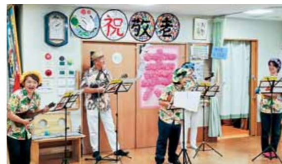
ウクレレクラブひだまりもサマになってきました

2日目は、「ウクレレクラブひだまり&フラックとひろば」をお迎えしました。恒例のウクレレ演奏に、キレイなフラダンスが加わり、男性利用者さんも目をキラキラとさせ、きつと若返ったことでしょうか。 今回、久しぶりにあつたかハウス今津との合同で行事ができ、とても嬉しく思いました。 (仲宗根晴美)