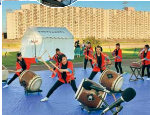
和太鼓の演奏で舞台がスタート!