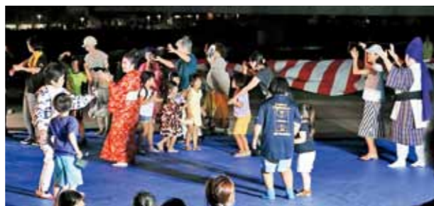
大人も子どもも一緒に楽しんでいました♪

9月16日、4年ぶりとなる納涼のつどいが武庫川河川敷にておこなわれました。 久しぶりの開催となったため、実行委員のメンバーは、今回より新しい方にも協力いただきました。 当日は、雲ひとつない青空に恵まれ、開会の16時を今か今かと待つ子どもたちの姿も…。 今年はこのお祭りもすごい人だったので「納涼のつどいもきつとたくさんの方が来られるぞ」と覚悟しておりましたが、それをはるかに上回る方で賑わいました。 フランクフルトや綿菓子、ポップコーンは早々に売り切れ、やきそばや射的には長蛇の列ができました。たくさんの方に来てもらい嬉しい反面、買えなかったり、お待たせしてしまった皆さんにはこの場を借りてお詫言ひいたします…。 17時からじまった中央舞台には、和太鼓や吹奏楽、エイサーといった恒例の催しや、ウクレレ&フラダンスなどの新しいグループもあり、盛り上がりしました。特に琉球舞踊の最後に、客席の皆さんにも一緒に踊ってもらう「カチャーシー」では、ステージに入りきらないくらいの人々が溢れ、一緒に踊った方も、それを見ている客席の方もみんな笑顔になりました。 (前田秀輔)