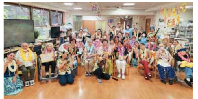
さいごはみんなアローハ〜♥

ただきました。演奏の際に使ったお面は、利用者さんが数か月かけて作ってくださいました。 「何作ってるんや