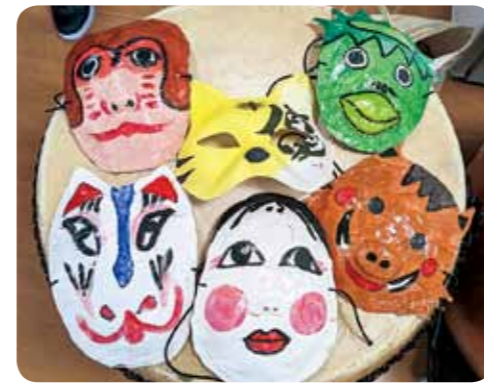
数カ月かけて作りました

ただきました。演奏の際に使ったお面は、利用者さんが数か月かけて作ってくださいました。 「何作ってるんや