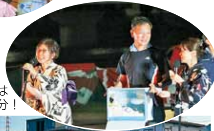
▶最後は福引 抽選会。一等は 商品券一万円分!