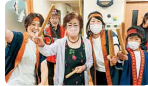
パチをかまえて はい! ポーズ

2日間の催しの1日目は、あつたかハウス今津の利用者さんと一緒に、和太鼓の演奏を楽しみました。はじめに今年の「たから」1・2月号で表紙を飾ったため太鼓班の演奏を聴いて